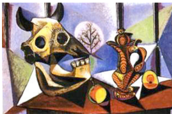
Pablo Picasso – Nature morte au crâne de taureau et aux fruits – 1939 – huile sur toile – 65 x 92 cm – The Cleveland Museum of Arts, États-Unis.