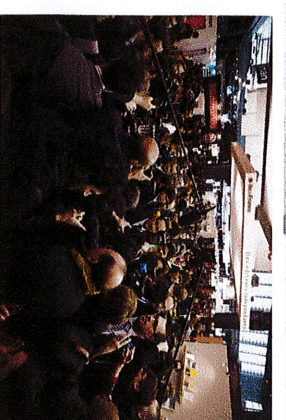
François Hollande en Mars 2012

François Hollande, fervent défenseur de la liberté d'expression : A l'occasion du Salon du Livre qui se tient en ce moment à Paris, le président de la République a défendu l'attachement de la France à sa liberté d'expression. Selon lui, la France doit sa force à sa culture et à sa liberté. En effet, l'édition 2015 du Salon du Livre a pris une tonalité particulière avec les attentats du 11 Janvier qui visait la rédaction de Charlie Hebdo. L'album « La BD est Charlie » a notamment été remis à François Hollande qui considère sa présence au Salon du Livre comme une véritable réponse aux attentats de la capitale. A travers la présence du chef de l'Etat, la littérature apparaît, plus que jamais comme un véritable défenseur de la liberté de pensée.