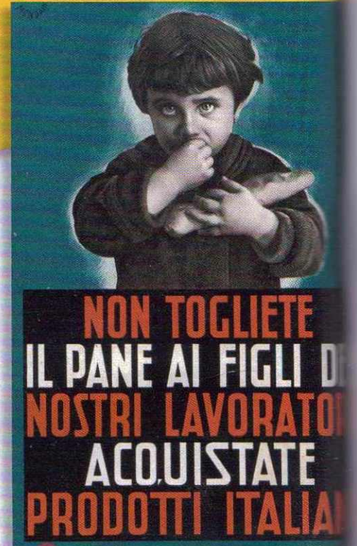
2 Propaganda fascista: manifesto del 1935