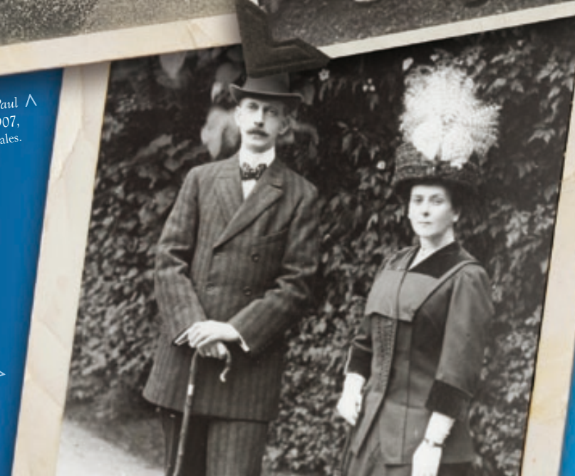
> Le grand-duc Paul de Russie et sa seconde épouse la princesse Paley en 1911 © Collection Cyrille Boulay.