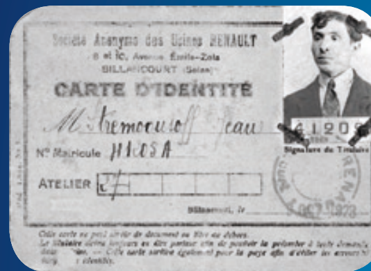
^ Carte du personnel des usines Renault © Jacques Noël.

Ils vivent dans des conditions pénibles et précaires, semblables à celles des immigrants d'autres pays, vivant les conditions difficiles de l'exil et de l'intégration.