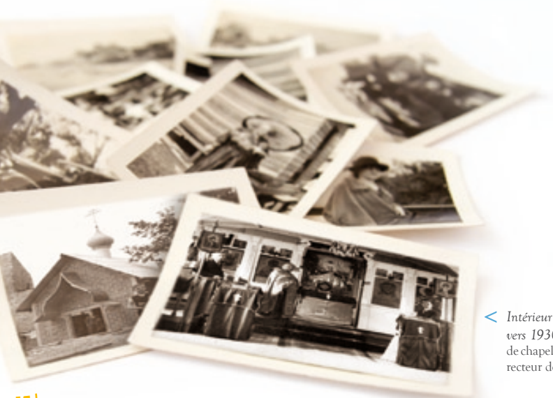
< Intérieur de l'église Saint-Nicolas-le-Thaumaturge vers 1930. À gauche, Pierre Spassky, maître de chapelle, et au centre l'archiprêtre Yakov Ktitareff, recteur de la paroisse.

Détruite par les bombardements de 1943, l'église est relevée en 1953 selon les plans de l'architecte Kirkwood qui dessine une simple nef recouverte d'un toit à deux pentes lui-même surmonté d'un bulbe bleu. Comme en Russie.