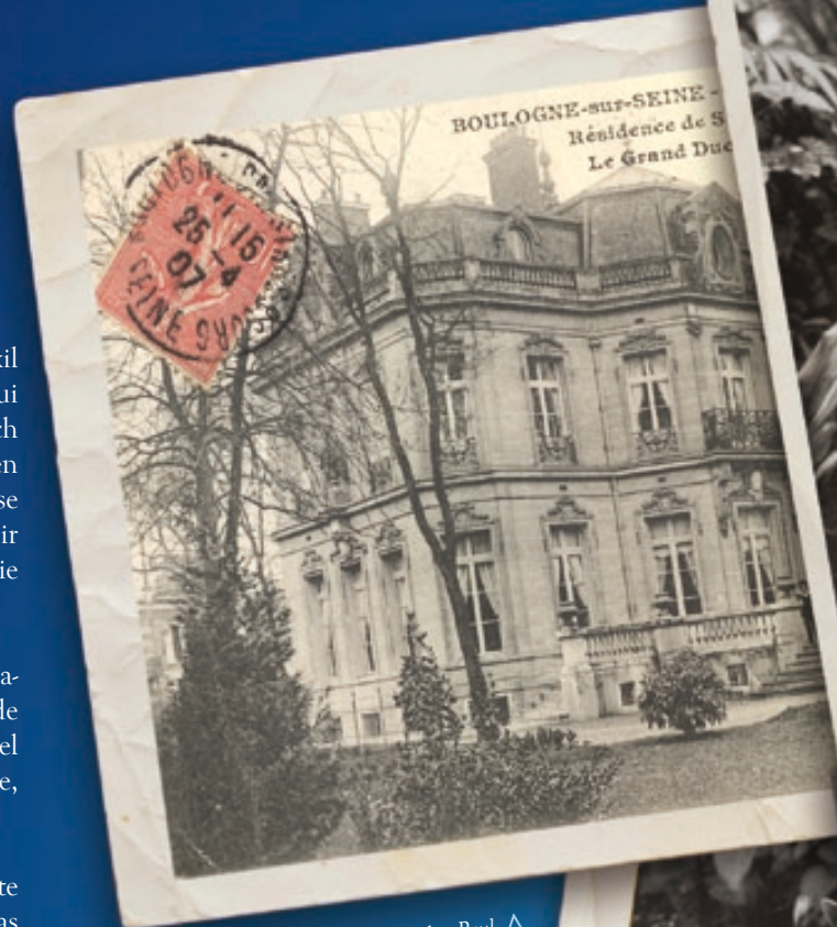
^ Résidence du grand-duc Paul à Boulogne en 1907, Boulogne-Billancourt, Archives municipales.

Après la mort tragique de son mari, fusillé par les bolcheviks, la princesse Paley revient en France et vend en 1921 l'hôtel de Boulogne à une congrégation religieuse qui prend alors le nom de Cours Dupanloup.