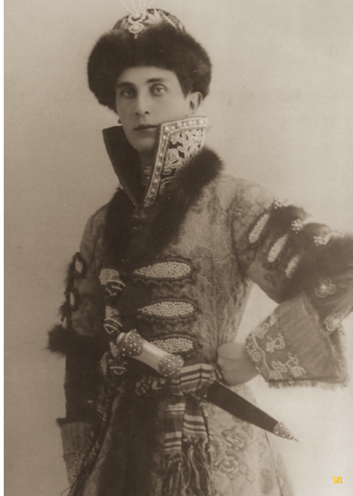
Le prince Félix Youssouпов > en costume de boyard © Cyrille Boulay.