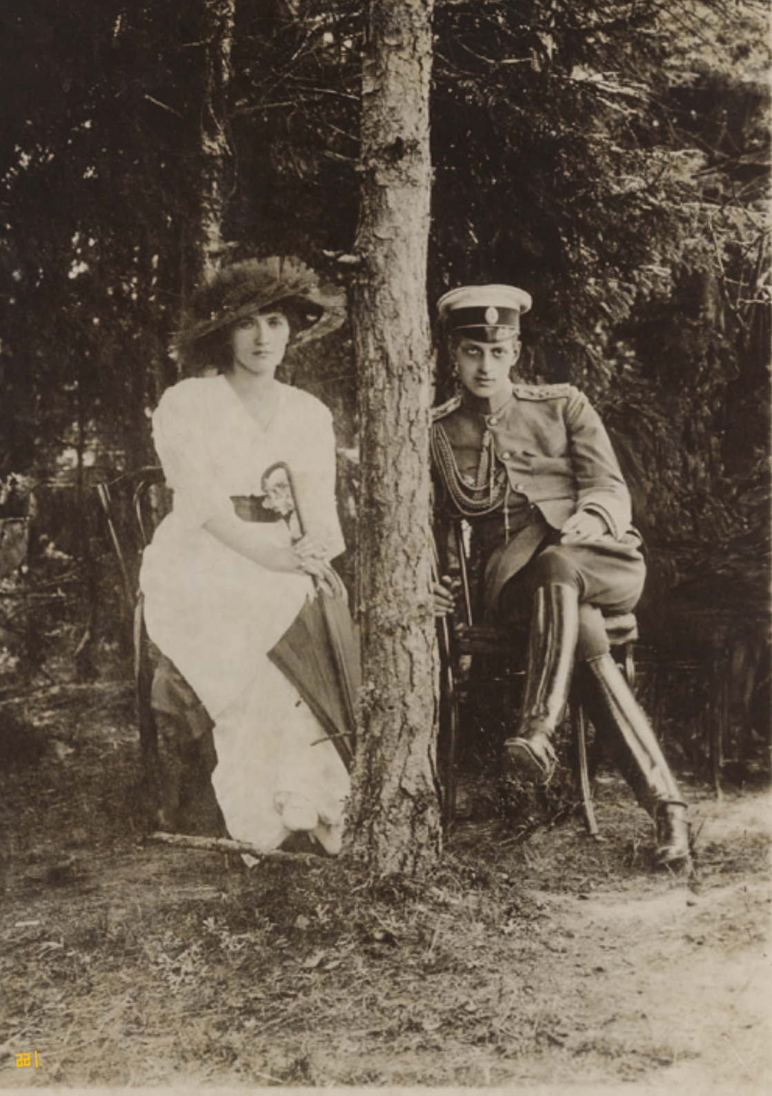
< Le grand-duc Dimitri et sa sœur la grande-duchesse Marie de Russie vers 1910

Marie de Russie, Mémoires. Une princesse en exil , Paris, librairie Delamain et Boutelleau, 1933, p. 267.