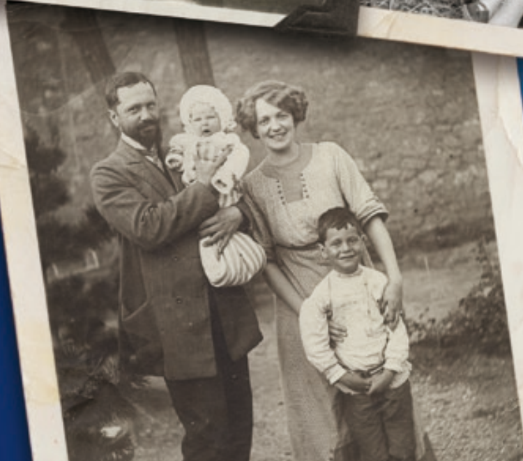
< Famille du peintre Léonidas Inglesis © Anna Christophoroff.