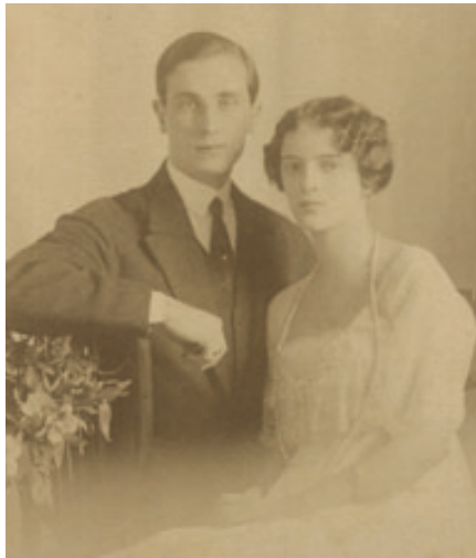
▲ Le prince Félix Youssouпов et Irina lors de leurs fiançailles en 1914

En 1934, il quitte Boulogne pour Sarcelles puis pour Paris où il emménage rue Pierre-Guérin dans le XVI e arrondissement.