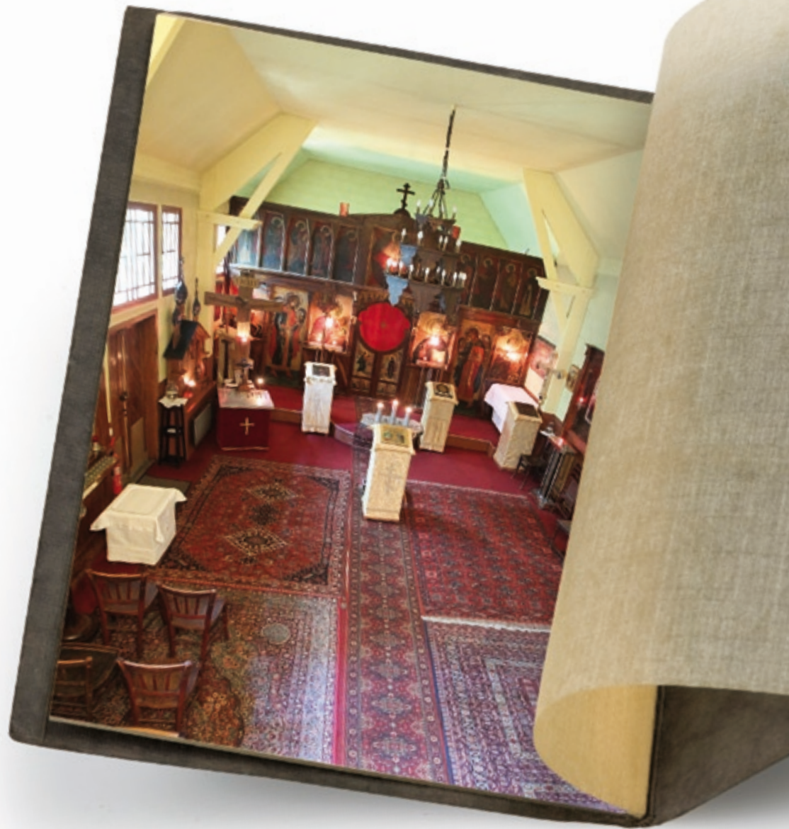
^ Intérieur de l'église Saint-Nicolas-le-Thaumaturge © Bahi.