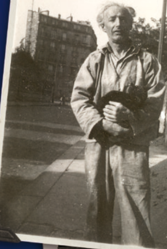
< Le sculpteur Nathan Imenitoff rue du Château, on aperçoit à l'arrière-plan la place Denfert- Rochereau © Gefman.