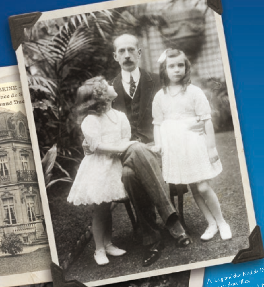
^ Le grand-duc Paul de Russie et ses deux filles, à gauche Natalie, à droite, Irène.