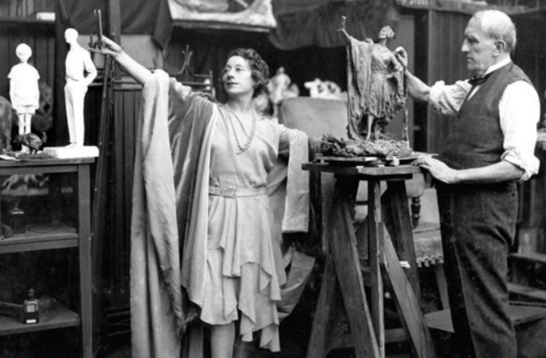
^ Le sculpteur Troubestkoy.