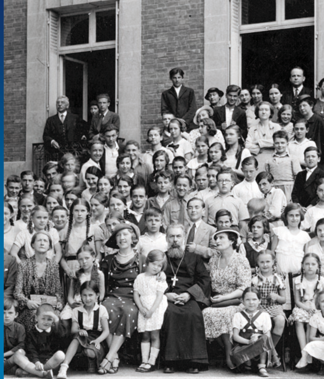
L'école secondaire russe, au centre à droite du prêtre, Lady Deterding © Nicolas Spassky.