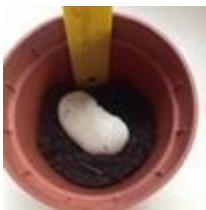
Graine + de la terre + pas d'eau + de la lumière