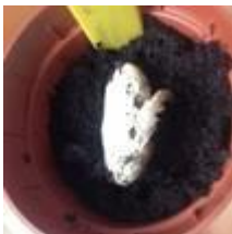
Graine + de la terre + de l'eau en quantité suffisante à l'obscurité