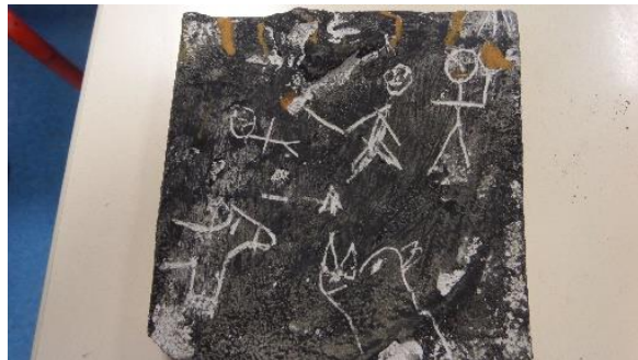
Quelques-unes de nos œuvres