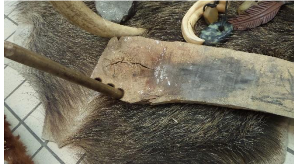
ce qu'il faut pour faire le feu