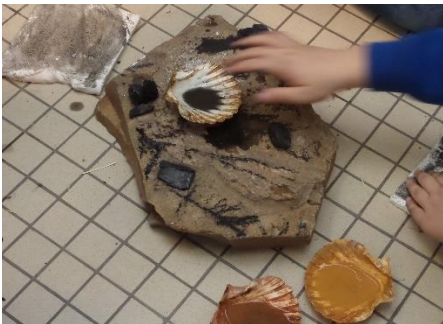
La préparation de nos peintures

Dans une deuxième partie de séance, nous avons participé à un atelier de peinture/gravure à la mode préhistorique.