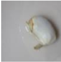
Graine sans terre + de l'eau en quantité suffisante + de la lumière