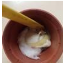
Graine sur du coton + de l'eau en quantité suffisante + de la lumière