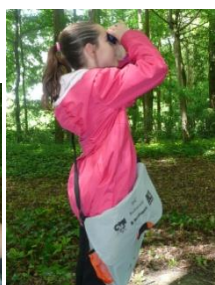
→ l'observation des oiseaux :