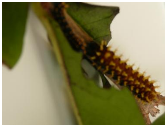
Chenille au 3ème stade larvaire