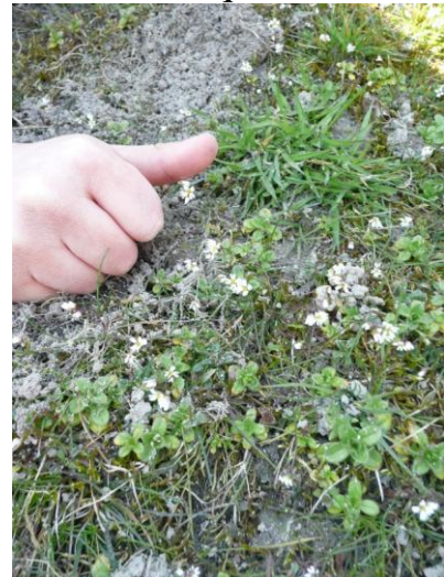
Une très petite fleur : la Stellaire media appelée aussi « mouron des oiseaux »