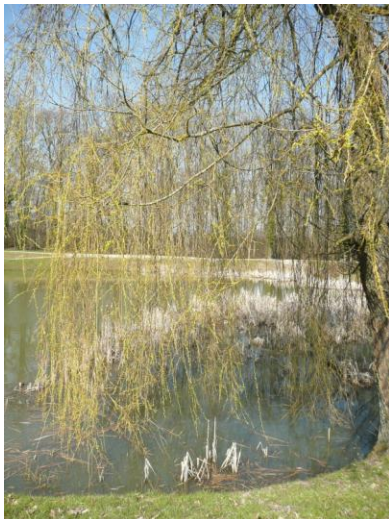
Le saule pleureur

Autour de la mare, sur la butte, quelques éléments de la flore très caractéristiques :