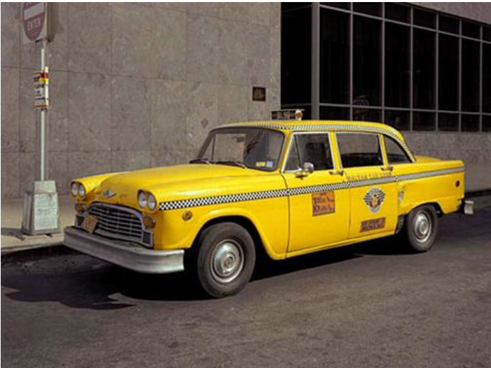
Le cab (taxi)