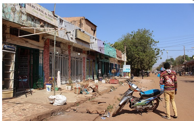
4. Rue du quartier de Korofina à Bamako