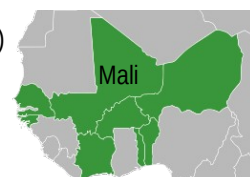
Pays membres de l'U.E.M.O.A