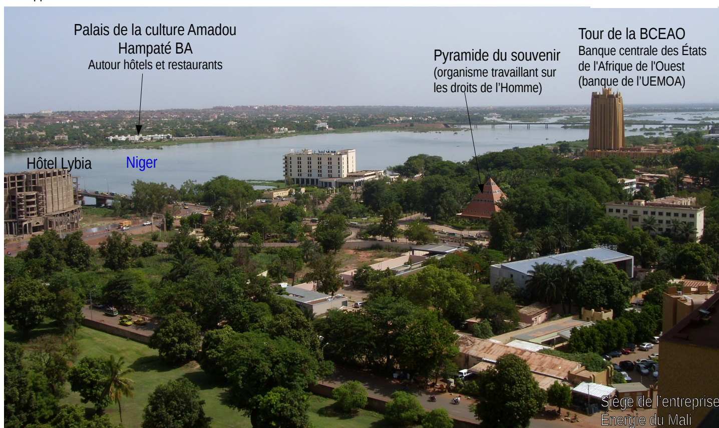
3. Vue du centre-ville de Bamako