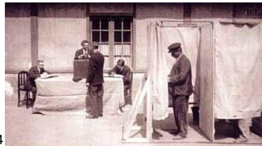
Elections municipales de 1914

Loi du 29 juillet 1913, art. 4: A son entrée dans la salle du scrutin, l'électeur, après avoir fait constater son identité prend lui-même une enveloppe. Il doit se rendre isolément dans la partie de la salle aménagée pour le soustraire aux regards pendant qu'il met son bulletin dans l'enveloppe.